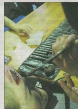
Faire une fausse plaie sur le front : un travail de précision.

ment on travaille dans les coulisses du cinéma, estime la maquilleuse professionnelle. Des coulisses qui ne sont pas facilement accessibles, comme pour la danse ou le cirque. On ne peut pas visiter un plateau de tournage.