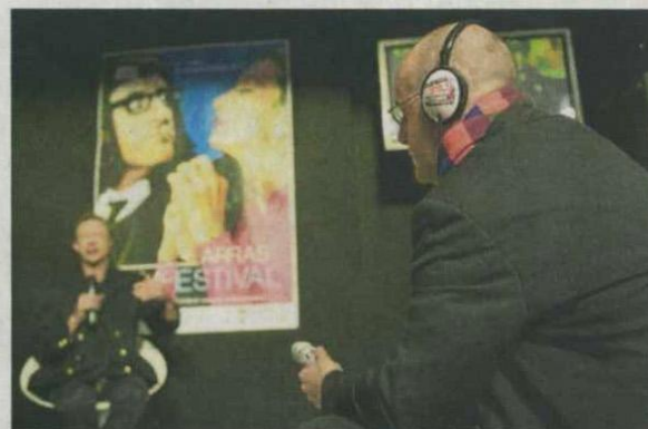
PFM, Planète FM, France Bleu, Wéo, France 3 régional, Télé Gohelle, « La Voix » et les hebdomadaires locaux couvrent le festival.

Avec soixante-cinq accréditations presse déjà délivrées, la couverture médias du festival semble s'étoffer au fil des ans. En plus de la presse locale et régionale (journaux, radios, télévisions), divers sites Internet rendent compte de la manifestation « en live ». Il y a Cinémotion et Écran Noir, mais aussi des blogueurs (mon cinématographe, rendez-vous cinéma,...), ou des sites plus généralistes (Mic Mag, Lille la nuit). Du côté des médias natio-